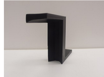
Fig. 2 作成した取り付け治具