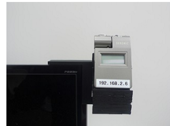
Fig. 3 取り付け治具をセットしたディスプレイ