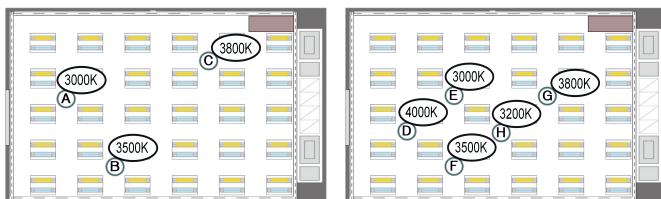
図 2: 設定 1

任意の計測位置において、要求された色温度が実現できるか、動作実験を行った。センサの位置を図 2 および図 3 に示す。実際の色温度は、色彩照度計を用いて計測した。